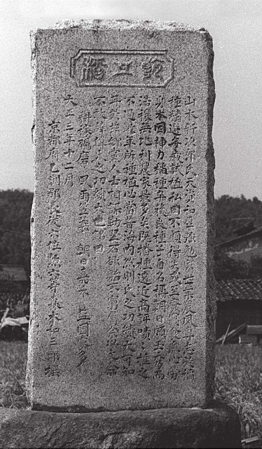
朝日稻(旭米)顕彰碑

向日市寺戸町天狗塚の墓地にある江戸時代の学者・文人の墓碑や、向日市・乙訓地域にある記念碑を、写真や拓本で展示して紹介します。