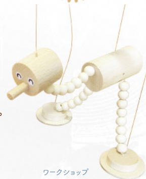
ワークショップ 糸あやつり人形 (イメージ)

[会場] 本ギャラリー内 多目的ルーム [定員] 各回15名 [参加費] 1,500円(税込) 要予約