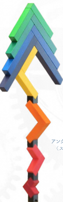
アンゲラ (積み木) (スイス ネフ社)