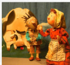
糸あやつり人形劇 (イメージ)