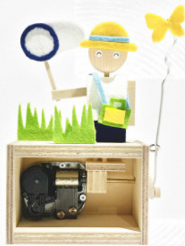
ワークショップ からくりオルゴール (イメージ)

永守コレクションギャラリー NAGAMORI COLLECTION GALLERY